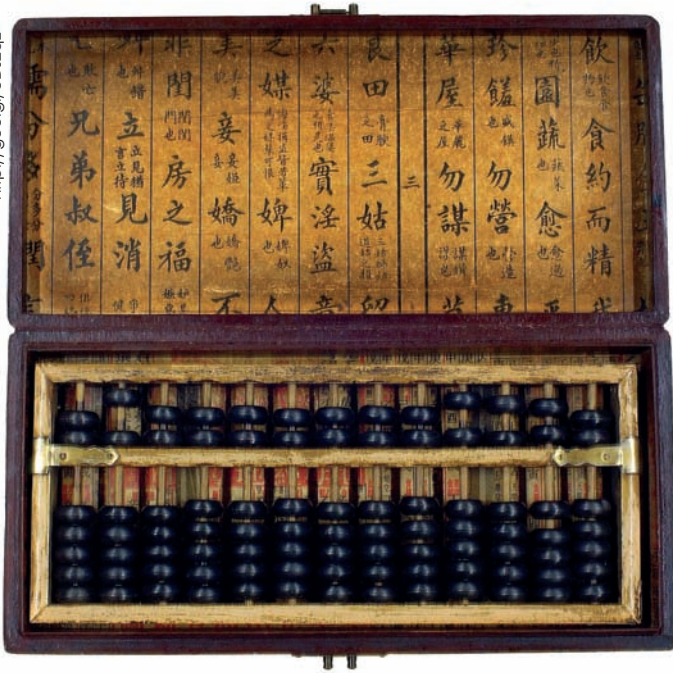
■ Antiguo ábaco chino