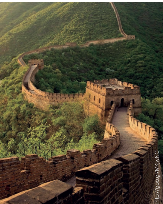
■ La Gran Muralla China

Para conocer el complejo proceso de producción de la seda, observa el video que aparece en este enlace: https://goo.gl/hKdroU .