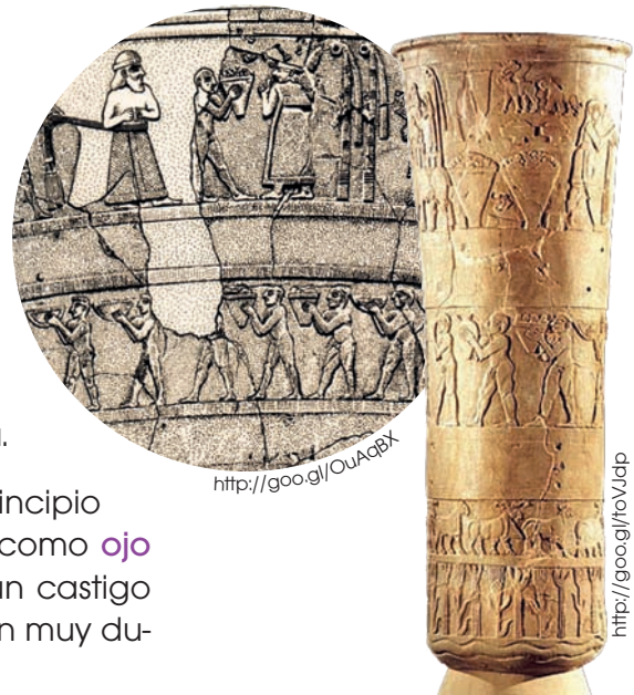
■ Vaso de Uruk, Está adornado con cuatro franjas alusivas a las fiestas de año nuevo.

Por otra parte, también Mesopotamia fue donde comenzó a usarse el bronce , hacia finales del IV milenio a. C.