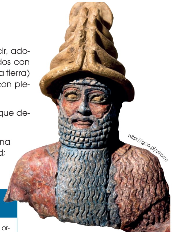
■ Shamash. Dios babilonio del Sol

La religión mesopotámica no ofrecía la esperanza de una vida mejor tras la muerte, ni esperaba la inmortalidad; por eso, aplicaba sus conocimientos para mejorar la existencia terrenal.