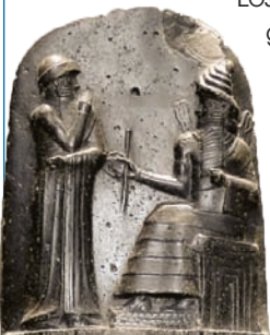
■ Leyes grabadas en escritura cuneiforme

El Código de Hammurabi no dicta normas religiosas, sino que regula los derechos y deberes ciudadanos: establece indemnizaciones por robos, daños o heridas; indica las compensaciones por incumplir acuerdos, o establece las penas por los distintos crímenes.