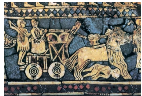
■ Estandarte de Ur (III milenio a. C.). Escena con carro de guerra