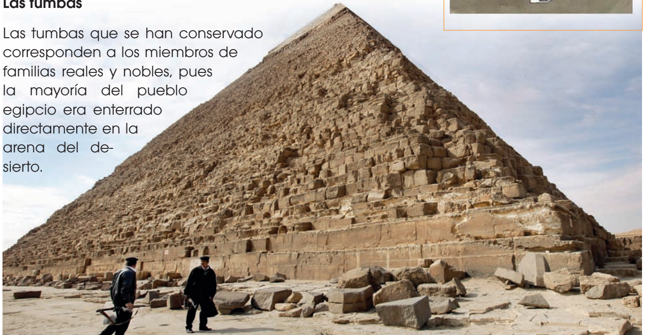
■ La Gran Pirámide de Keops

Las tumbas que se han conservado corresponden a los miembros de familias reales y nobles, pues la mayoría del pueblo egipcio era enterrado directamente en la arena del desierto.