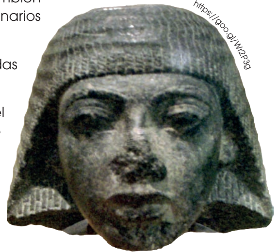
■ Narmer, primer faraón y fundador de la Dinastía I